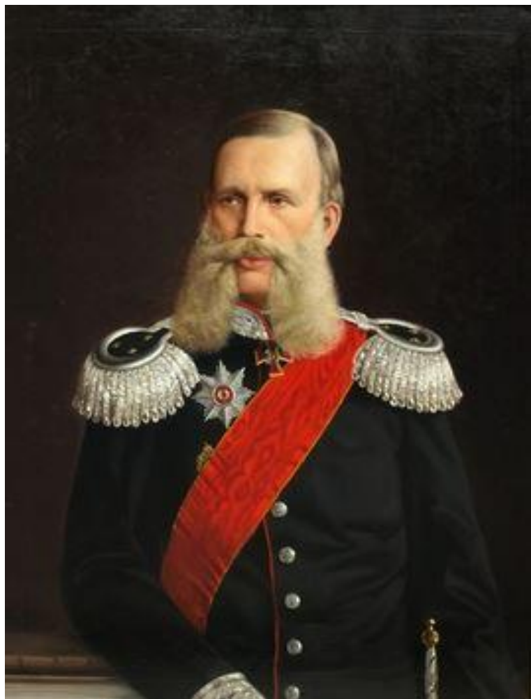
ЧИСТОВИЧ Яков Алексеевич (1820— 1885), отечественный гигиенист, судебный медик и историк медицины